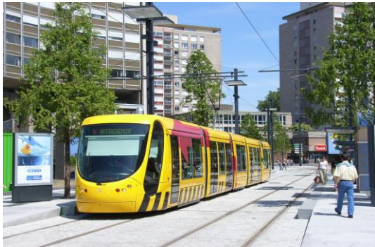
Alstom-Citadis in Mulhouse (Christian Buisson)

Mittwoch, x. August Mulhouse , Straßenbahn-Linien 1, 2 und 3; Betriebshof Mertzau, gemeinsame Werkstatt für Citadis und Avanto; fakultativ: Eisenbahn-Museum (Nachmittag)