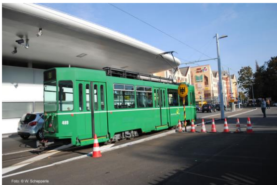
Tram der SL 8 am Zollhaus Weil am Rhein

alternativ: Bahnfahrt nach Zürich, Besuch vom Tram Museum Zürich, Oldtimerfahrt, Besuch der Limmatalbahn, neue Fahrzeuge als Tagesausflug von Weil am Rhein aus.