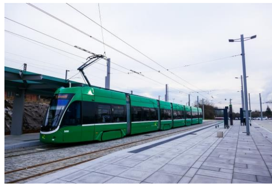
Gare de Saint Louis mit Flexity auf Linie 3