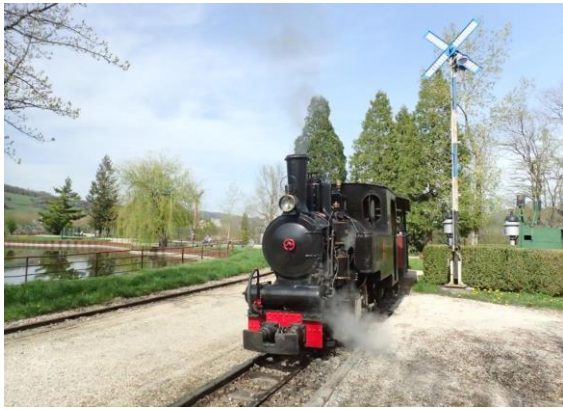
Dampfzug bei der Schinznacher Baumschulbahn