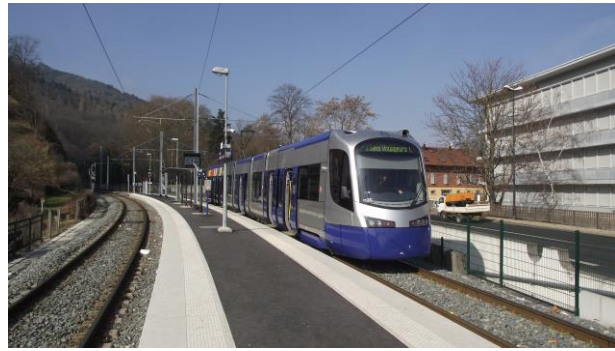
Siemens-Avanto als TramTrain in Thann

Donnerstag, x. August Basel , teilweise Sonderfahrt, drei "internationale" Strecken: Weil am Rhein (SL 8), Saint-Louis (SL 3), Leymen (SL 10); Besichtigung des Depots Dreispitz mit Museumswagen, dort ab Februar ein kleines Tram-Museum