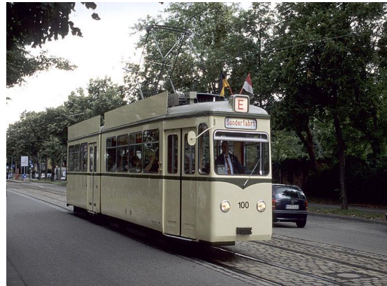
Freiburger Museums-Tw GT4 100 "Sputnik"

Samstag, x. August Freiburg , Sonderfahrt mit Museumswagen, Besuch des Straßenbahn-Museums, Sonderfahrten werden nur an Samstagen durchgeführt!!!