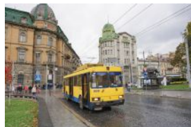
Kurztagung Lviv (UA)