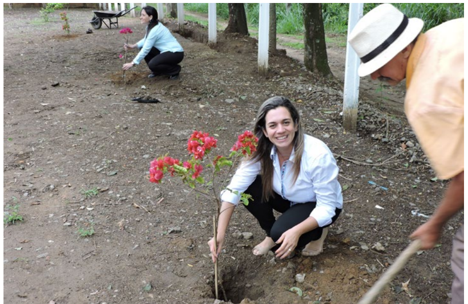
Funcionários se cotizaram para comprar mudas de Primavera e plantá-las

Como presente pelo aniversário, a Prefeitura de Pindamonhangaba também cedeu novas mudas de Ipê na cor amarela. Os locais foram escolhidos levando-se em conta o porte das árvores e as condições do solo para recebê-las.