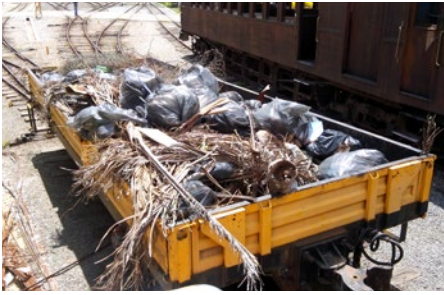
Até objetos domésticos descartados indevidamente são encontrados na via

a operação Cata Bagulho, realizada por dois trens de serviço e manutenção.