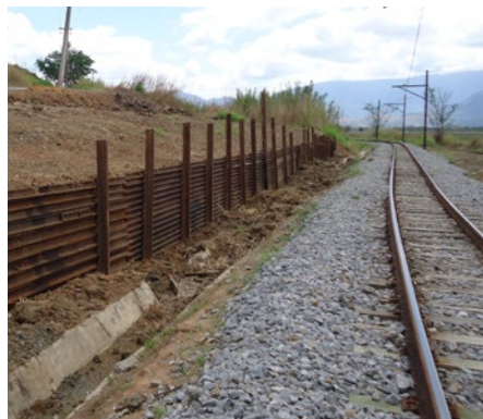
Trabalho protege a via permanente de erosão