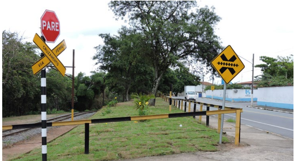
Os cruzamentos ganham nova sinalização

Outros serviços igualmente importantes têm a ver com a zeladoria da faixa ferroviária e melhorias incorporadas à rotina como: a fixação de contratrilhos, a limpeza constante de canaletas de drenagem, recuperação de encostas para prevenir erosão, a vedação de faixa, e a utilização de recursos paisagísticos para torná-la mais agradável.